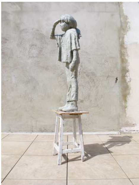
Karim Ghelloussi Sans-titre (La chase aux lézards) 2019 Résine & matériaux divers 180 x 40 x 40 cm