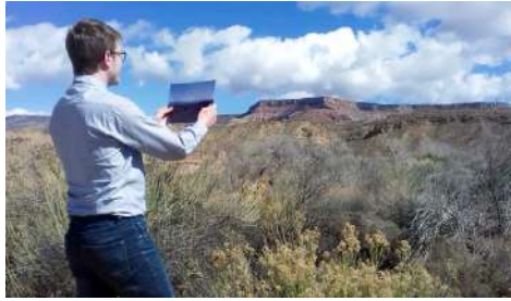
Romain Gandolphe À la recherche , vidéo, couleur, muet, 23 min, 2017.