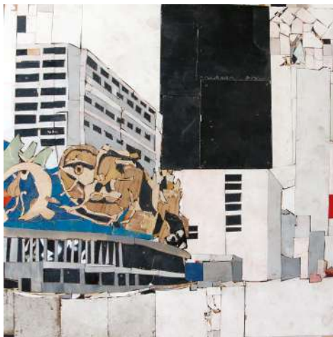
Karim Ghelloussi Ici comme ailleurs (Au Val D'argent) 2019 Chute de bois 140 x 140 x 4 cm