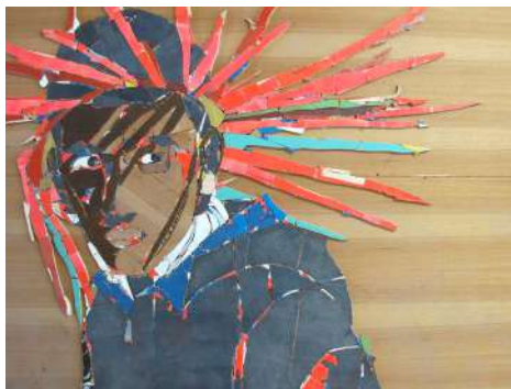
Karim Ghelloussi Le gars de Tébessa (Mémoire de la jungle) 2019 Chute de bois 146 x 175 x 4 cm