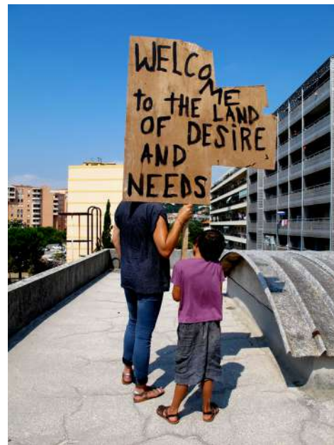
Karim Ghelloussi Welcome to the land of desire and needs 2015 Photographie encadrée 21 x 30 cm