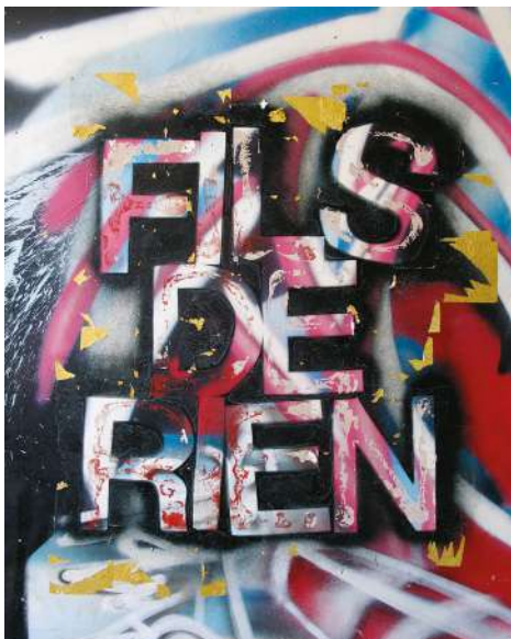
Karim Ghelloussi Fils De Rien 2018 95 x 77,5cm