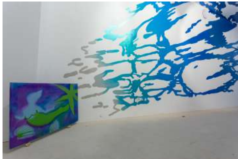
Hazel Ann Watling Pretty Thing and Spurt 2018 Hydrogynesis Metaxu Toulon